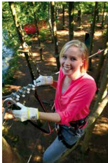
Das höchste der Gefühle

Mit unserer »S-Bahn«, einer Seilbahn von ungefähr 200 m Länge, »fliegen« Sie über Wasser – von einem Wald zum anderen!